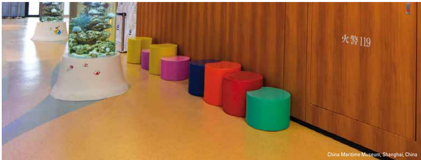
China Maritime Museum, Shanghai, China